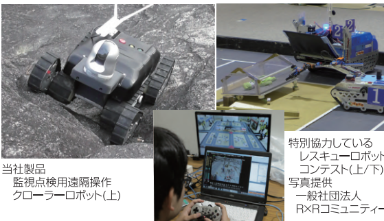
当社製品 監視点検用遠隔操作 クローラーロボット(上)