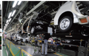
組立工場

高い信頼性を要求される産業用コンピュータハードウェア技術と豊富な実績に裏付けされたシステム化技術により、生産現場や社会インフラの現場などの「現場」の課題を解決する「高信頼システム」を提供しています。